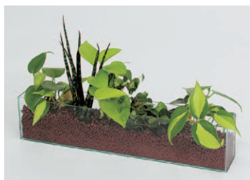
ハイドロカルチャー