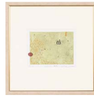
【岡田 まりゑ／あたたかい場所】 注文品番：HL-1540A ¥20,000(税込¥21,000) w315×h315×d22.5mm 0.8kg 材質：アルミシート貼り・アクリル紙 技法：銅版画 パネル(54)