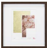
[中澤 慎一／SYNTAX1-6] 注文品番：HL-1552A ¥24,000(税込¥25,200) w317×h317×d21mm 0.8kg 材質：樹脂シート転写・アクリル・紙 技法：銅版画+箔 パネル(59)