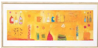
[エマ デイヴィス/HAPPY PAINTING] 注文品番：HL-1351B ¥47,000(税込¥49,350) w765×h365×d22.5mm 2.4kg 材質：アルミシート貼り・アクリル・紙 技法：ジークレー パネル(54)