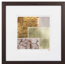
[中澤 慎一／SYNTAX V NO.5] 注文品番：HL-1555A ¥71,000(税込¥74,550) w610×h610×d26.5mm 2.7kg 材質：アルミシート貼り・アクリル・紙 技法：銅版画+箔 パネル(57)