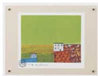
[マーク ゴドウィン／ PROSPECT-GREEN] 注文品番：HL-0471B ¥15,000(税込¥15,750) w440×h340×d23mm 0.8kg 材質：アクリル・紙 技法：ジークレー パネル(47)