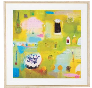
[エマ デイヴィス/ NOW WE ARE 30] 注文品番：HL-1353B ¥47,000(税込¥49,350) w565×h565×d22.5mm 2.6kg 材質：アルミシート貼り・アクリル・紙 技法：ジークレー パネル(54)