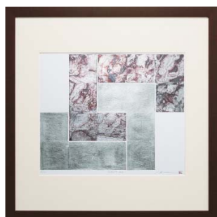
[中澤 慎一／SYNTAX-4-NO.2] 注文品番：HL-1417A ¥94,000(税込¥98,700) w810×h810×d26.5mm 4.2kg 材質：アルミシート貼り・アクリル・紙+箔 技法：銅版画+箔 パネル(57)