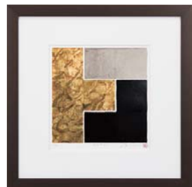
[中澤 慎一／SYNTAX V NO.4] 注文品番：HL-1554A ¥71,000(税込¥74,550) w610×h610×d26.5mm 2.7kg 材質：アルミシート貼り・アクリル・紙 技法：銅版画+箔 パネル(57)