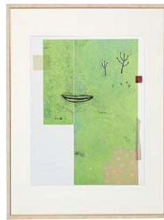
【岡田 まりゑ／風が吹くたびに】 注文品番：HL-1427B ¥81,000(税込¥85,050) w559×h741×d22.5mm 2.8kg 材質：アルミシート貼り・アクリル紙 技法：銅版画 パネル(54)