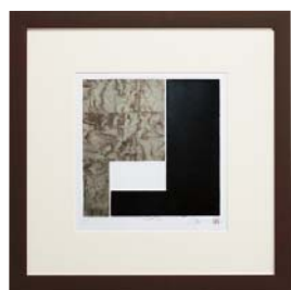
[中澤 慎一／SYNTAX-3-NO.5] 注文品番：HL-1414A ¥71,000(税込¥74,550) w610×h610×d26.5mm 2.6kg 材質：アルミシート貼り・アクリル・紙+箔 技法：銅版画+箔 パネル(57)