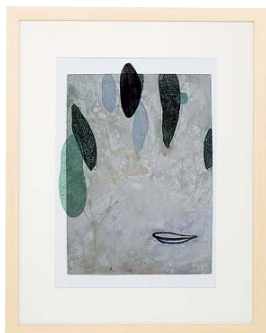
【岡田 まりゑ／RAINY FOREST】 注文品番：HL-1426B ¥102,000(税込¥107,100) w720×h910×d26.5mm 4.7kg 材質：アルミシート貼り・アクリル紙 技法：銅版画 パネル(57)