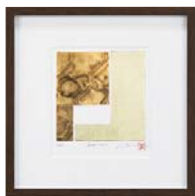
[中澤 慎一／SYNTAX1-5] 注文品番：HL-1551A ¥24,000(税込¥25,200) w317×h317×d21mm 0.8kg 材質：樹脂シート転写・アクリル・紙 技法：銅版画+箔 パネル(59)