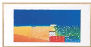
[マーク ゴドウィン／ESTATE-2] 注文品番：HL-1360B ¥41,000(税込¥43,050) w715×h365×d22.5mm 2.2kg 材質：アルミシート貼り・アクリル・紙 技法：ジークレー パネル(54)