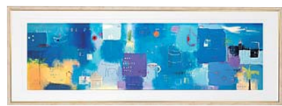
[エマ デイヴィス/HOLIDAYS] 注文品番：HL-1399B ¥55,000(税込¥57,750) w1015×h365×d22.5mm 3.1kg 材質：アルミシート貼り・アクリル・紙 技法：ジークレー パネル(54)