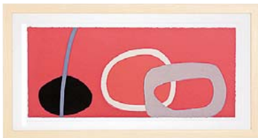
[ヘティ ハックスワース/RED PEBBLE] 注文品番：HL-1444B ¥110,000(税込¥115,500) w1060×h560×d26.5mm 4.1kg 材質：アルミシート貼り・アクリル紙 技法：ジークレー パネル(57)