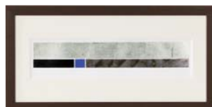
[中澤 慎一／STATICS I NO.1] 注文品番：HL-1495A ¥53,000(税込¥55,650) w810×h410×d26.5mm 2.4kg 材質：アルミシート貼り・アクリル・紙+箔 技法：銅版画+箔 パネル(57)