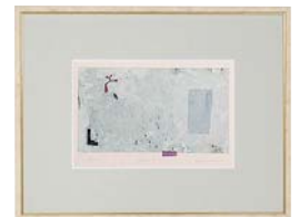
【岡田 まりゑ／SERENITY】 注文品番：HL-1430B ¥30,000(税込¥31,500) w523×h408×d22.5mm 1.6kg 材質：アルミシート貼り・アクリル紙 技法：銅版画 パネル(54)