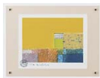
[マーク ゴドウィン／ PROSPECT-YELLOW] 注文品番：HL-0470B ¥15,000(税込¥15,750) w440×h340×d23mm 0.8kg 材質：アクリル・紙 技法：ジークレー パネル(47)