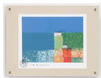
[マーク ゴドウィン／PROSPECT-NAVY] 注文品番：HL-1556A ¥15,000(税込¥15,750) w440×h340×d23mm 0.8kg 材質：アクリル・紙 技法：ジークレー パネル(47)