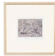
【岡田 まりゑ／そこここに】 注文品番：HL-1541A ¥20,000(税込¥21,000) w315×h315×d22.5mm 0.8kg 材質：アルミシート貼り・アクリル紙 技法：銅版画 パネル(54)