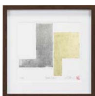
[中澤 慎一／SYNTAX1-7] 注文品番：HL-1553A ¥24,000(税込¥25,200) w317×h317×d21mm 0.8kg 材質：樹脂シート転写・アクリル・紙 技法：銅版画+箔 パネル(59)