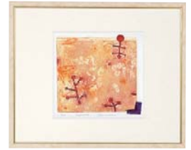
【岡田 まりゑ／HAPPINESS】 注文品番：HL-1433B ¥28,000(税込¥29,400) w438×h362×d22.5mm 1.2kg 材質：アルミシート貼り・アクリル紙 技法：銅版画 パネル(54)