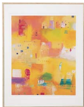
[エマ デイヴィス/DREAMING SPIRES] 注文品番：HL-1350B ¥70,000(税込¥73,500) w675×h865×d22.5mm 4.6kg 材質：アルミシート貼り・アクリル・紙 技法：ジークレー パネル(54)