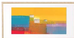
[マーク ゴドウィン／ESTATE] 注文品番：HL-1359B ¥41,000(税込¥43,050) w715×h365×d22.5mm 2.2kg 材質：アルミシート貼り・アクリル・紙 技法：ジークレー パネル(54)