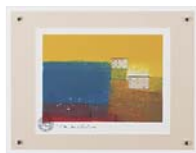
[マーク ゴドウィン／ PROSPECT-NABLE] 注文品番：HL-0475B ¥15,000(税込¥15,750) w440×h340×d23mm 0.8kg 材質：アクリル・紙 技法：ジークレー パネル(47)