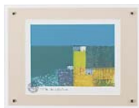
[マーク ゴドウィン／ PROSPECT-SKY] 注文品番：HL-0469B ¥15,000(税込¥15,750) w440×h340×d23mm 0.8kg 材質：アクリル・紙 技法：ジークレー パネル(47)