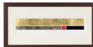
[中澤 慎一／STATICS I NO.2] 注文品番：HL-1496A ¥53,000(税込¥55,650) w810×h410×d26.5mm 2.4kg 材質：アルミシート貼り・アクリル・紙+箔 技法：銅版画+箔 パネル(57)