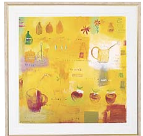
[エマ デイヴィス/ MR. STOKES'S MUSICAL FREEDOM] 注文品番：HL-1354B ¥47,000(税込¥49,350) w565×h565×d22.5mm 2.6kg 材質：アルミシート貼り・アクリル・紙 技法：ジークレー パネル(54)