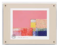
[マーク ゴドウィン／PROSPECT-PINK] 注文品番：HL-1557A ¥15,000(税込¥15,750) w440×h340×d23mm 0.8kg 材質：アクリル・紙 技法：ジークレー パネル(47)