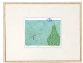
【岡田 まりゑ／ふたたび】 注文品番：HL-1429B ¥30,000(税込¥31,500) w523×h408×d22.5mm 1.6kg 材質：アルミシート貼り・アクリル紙 技法：銅版画 パネル(54)