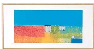
[マーク ゴドウィン／ESTATE-3] 注文品番：HL-1361B ¥41,000(税込¥43,050) w715×h365×d22.5mm 2.2kg 材質：アルミシート貼り・アクリル・紙 技法：ジークレー パネル(54)