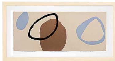
[ヘティ ハックスワース/YELLOW PEBBLE] 注文品番：HL-1445B ¥110,000(税込¥115,500) w1060×h560×d26.5mm 4.1kg 材質：アルミシート貼り・アクリル紙 技法：ジークレー パネル(57)