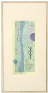
【岡田 まりゑ／私達はきっと】 注文品番：HL-1428B ¥42,000(税込¥44,100) w365×h715×d22.5mm 2.0kg 材質：アルミシート貼り・アクリル紙 技法：銅版画 パネル(54)