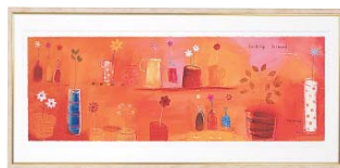
[エマ デイヴィス/FRIENDS ARE LIFE] 注文品番：HL-1352B ¥47,000(税込¥49,350) w765×h365×d22.5mm 2.4kg 材質：アルミシート貼り・アクリル・紙 技法：ジークレー パネル(54)